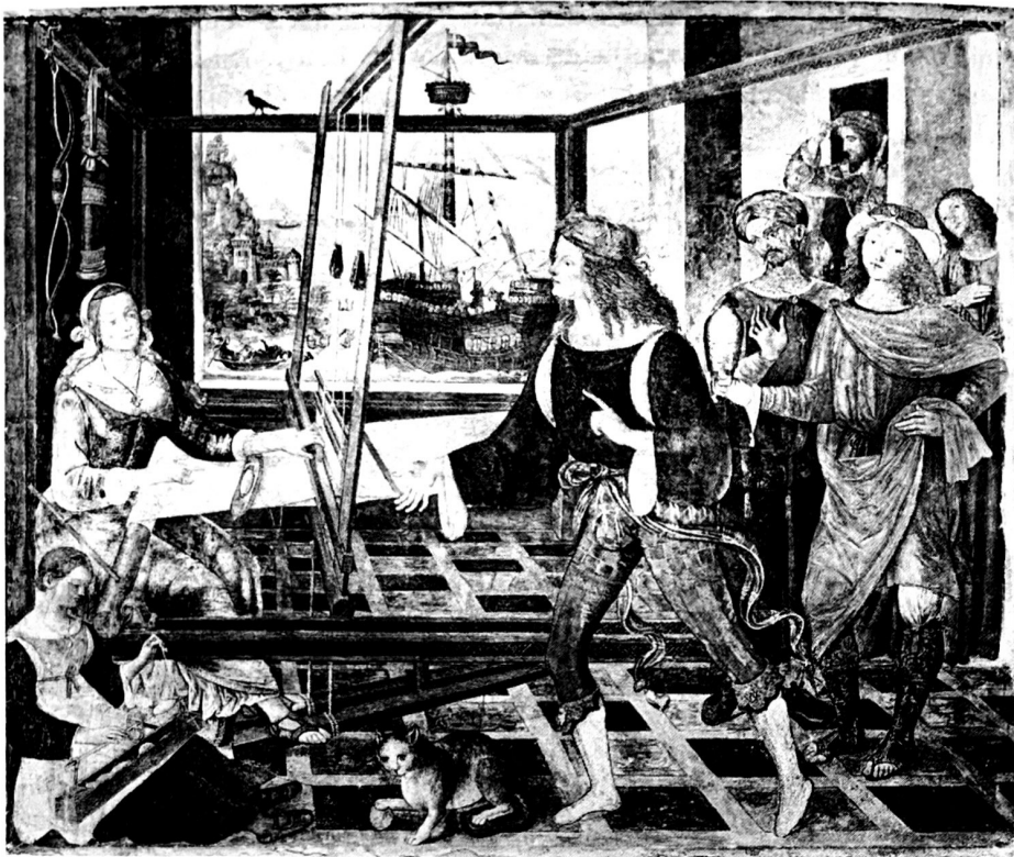
27. Bernardino Pinturicchio, Szene aus der Odyssee (um 1509). London, National Gallery. Fresko.

nen, die wir nur halb verstehen. Macht der eindringliche und wohlgekleidete junge Mann im Vordergrund mit seiner geöffneten Hand und dem erhobenen Finger Vorhaltungen oder erzählt er etwas? Zeigt der Mann mit dem Turban und der offenen Handfläche Überraschung, Bestürzung oder vielleicht gar Sympathie? Verrät die nur halb sichtbare Figur ganz rechts, mit der Hand auf dem Herzen und dem nach oben gerichteten Blick, ein angenehmes oder ein unangenehmes Gefühl? Was empfindet Penelope selbst? Zusammen führen diese Fragen zu der allgemeinen Frage: Was ist das Thema dieses Bildes? Stellt es den Telemach dar, wie er der Penelope von seiner Suche nach Odysseus berichtet, oder zeigt es die Freier, die Penelope bei ihrer List überraschen, das Leichentuch aufzutrennen, das sie zu weben behauptet? Wir kennen die Körpersprache zu wenig, um darüber Gewißheit zu erhalten.