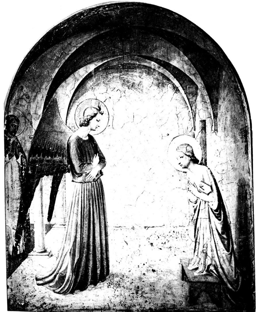
24d. Die Verkündigung in Florenz (1440–1460). Unterwerfung: Fra Angelico. Florenz, Museo di S. Marco. Fresco.