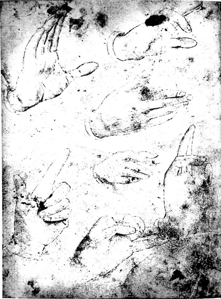
28. Florentinisch, Mitte des 15. Jahrh., Acht Handstudien. Rotterdam, Museum Boymans-van Beuningen. Kreide und Tusche.

Es gibt keine Lexika für die Gestensprache der Renaissance, nur einige Quellen, die Vermutungen über die Bedeutung von Gesten zulassen; sie haben zwar wenig Gewicht und müssen behutsam benutzt werden, aber Annahmen, die durch eine übereinstimmende Verwendung in Bildern erhärtet werden, spielen doch eine nützliche hypothetische Rolle. Leonardo empfahl dem Maler zwei Quellen, an die er sich wegen seiner Gesten wenden sollte – Redner und Taube. Wir können ihm darin zum Teil folgen und zwei Menschengruppen betrachten, die einiges von ihrer Gestik überliefert haben – Prediger und Mönche, die ein Schweigegelübde abgelegt haben. Von den letzteren kommen nur wenige Hinweise, nämlich Listen der Zeichensprache, die im Benediktinerorden für Zeiten des Schweigens entwickelt wurden. Von den mehreren hundert Zeichen in diesen Listen sind es ein halbes Dutzend wert, an Gemälden überprüft zu werden; zum Beispiel: