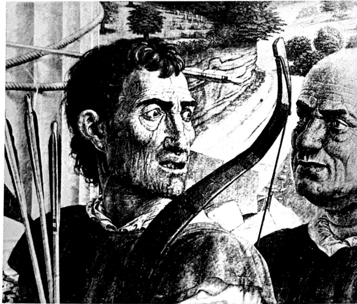
26. Andrea Mantegna, Detail eines Bogenschützen aus: Der hl. Sebastian (um 1475). Paris, Louvre. Leinwand.

schmack und den Traditionen des Malers offen, auch wenn einige von ihnen ein körperliches Merkmal als individuelles Kennzeichen trugen – wie zum Beispiel Paulus seine Kahlköpfigkeit.