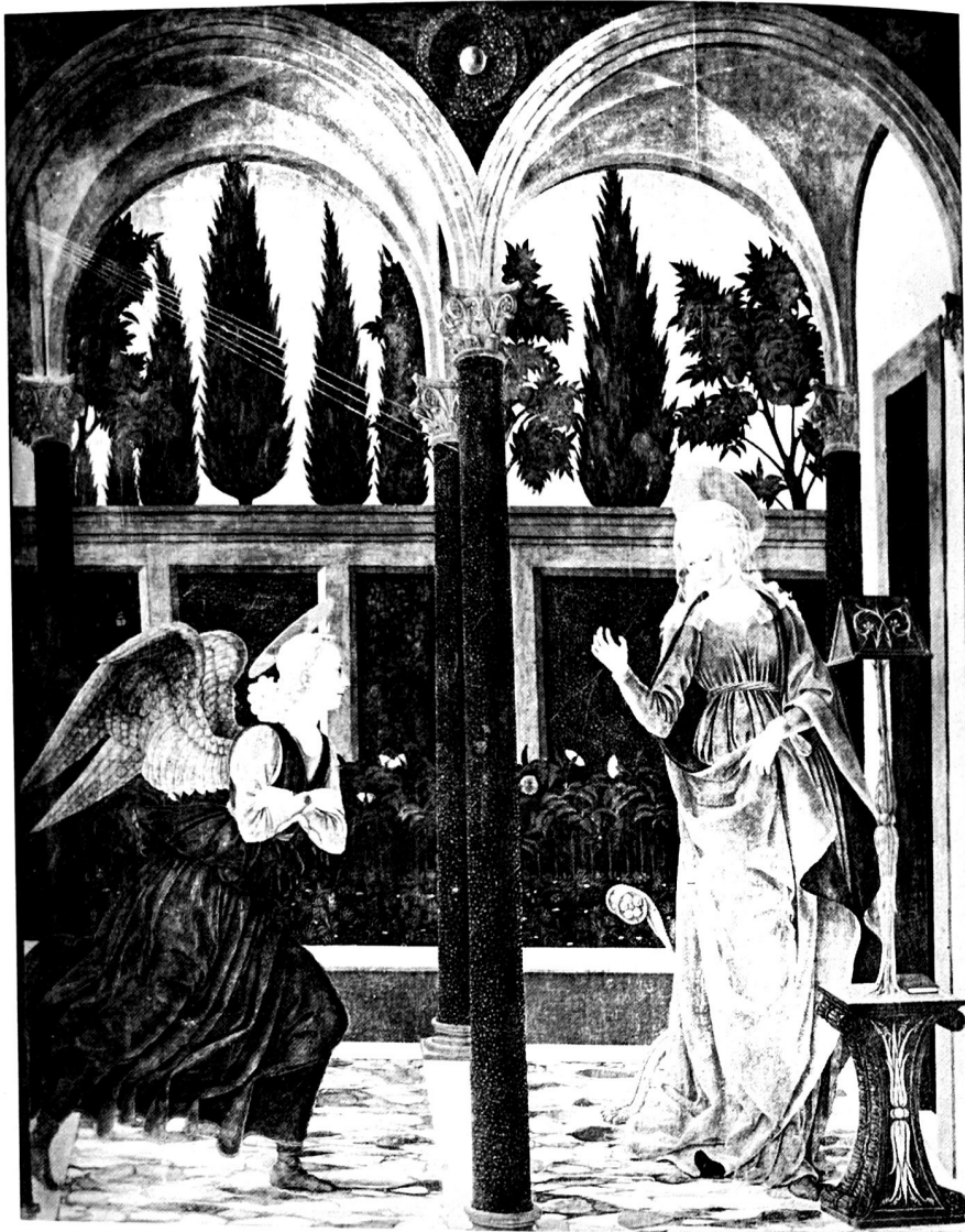
24c. Die Verkündigung in Florenz (1440–1460). Nachfragen: Alesso Baldovinetti. Florenz, Uffizien. Tafelbild.