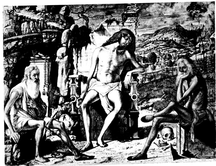
30. Vittore Carpaccio, Der tote Christus mit St. Hieronymus und Hiob (um 1490). New York, Metropolitan Museum of Art. Tafelbild.

Manchmal mit einem lebenswürdigen Ausdruck, indem er die Hände zu sich hin zieht [ attractio manum ], wie in: Kommet her zu mir, alle die ihr mühselig und beladen seid, ich will euch erquicken (Matthäus 11,28).