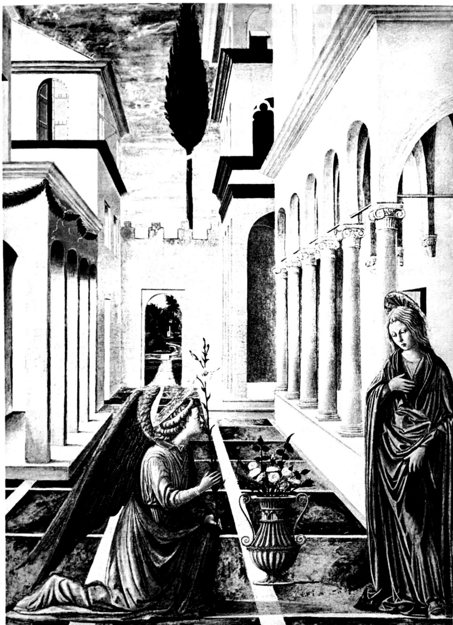
24b. Die Verkündigung in Florenz (1440–1460).

Überlegung: Meister der Barberini-Tafeln.