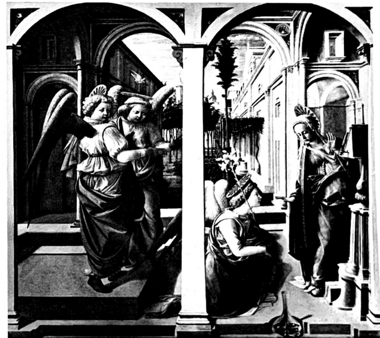
24a. Die Verkündigung in Florenz (1440–1460). Aufregung: Filippo Lippi. Florenz, S. Lorenzo. Tafelbild.

Die dritte lobenswerte Kondition wird Interrogatio genannt: Da sprach Maria zu dem Engel: Wie soll das zugehen, da ich doch von keinem Manne weiß?, das heißt, ... »da ich doch den festen Entschluß habe, von Gott eingegeben und durch meinen eigenen Willen gefestigt, niemals einen Mann zu erkennen«. Dazu sagt Francis Mayron: »Man könnte sagen, die glorreiche Jungfrau begehrte es mehr, Jungfrau zu sein, als den Sohn Gottes unter Verzicht auf ihre Jungfräulichkeit zu gebären, weil Jungfräulichkeit lobenswert ist und einen Sohn zu gebären nur ehrenvoll, was keine Tugend ist, sondern nur die Belohnung einer Tugend; und die Tugend ist erstrebenswerter als ihre Belohnung, da Tugend Verdienst einschließt, Belohnung jedoch nicht.« Aus diesem Grunde überlegte diese bescheidene, reine, keusche, unberührte Liebhaberin der Jungfernschaft, wie eine Jungfrau gebären könne ... [Abbildung 24(c)]