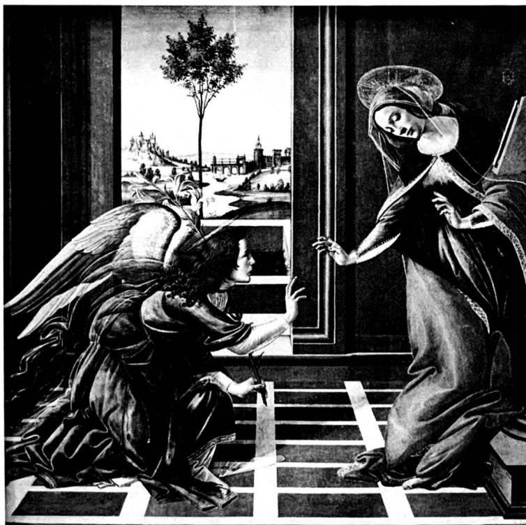
25. Botticelli, Verkündigung (um 1490). Florenz, Uffizien. Tafelbild.

Die Entwicklung der Malerei im 15. Jahrhundert vollzog sich in Formen emotionaler Erfahrung, die dem 15. Jahrhundert eigen waren.